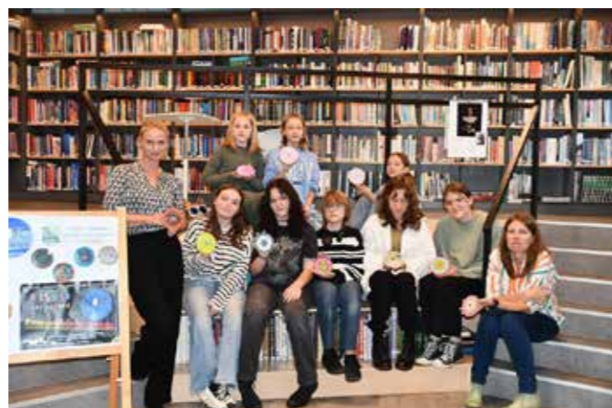
fol. MIPBP Nowy Tomyśl