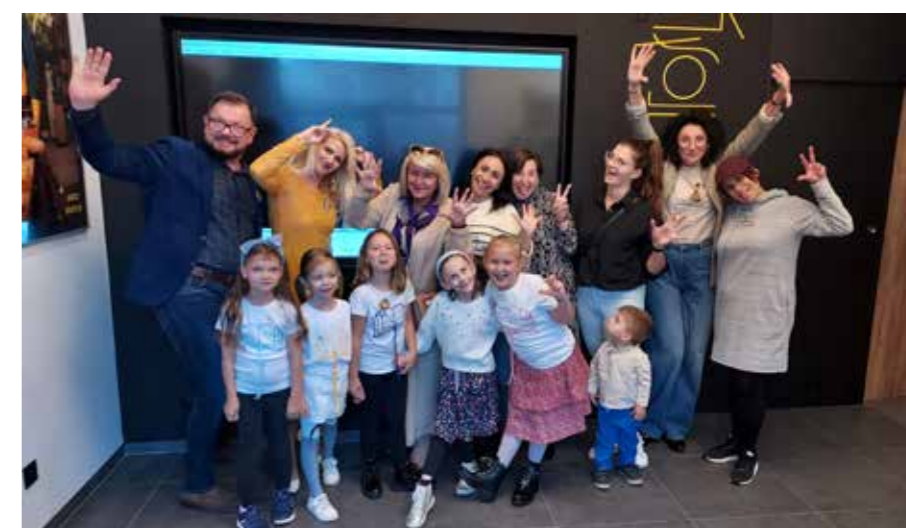
fol. MBP Kalisz

Ray of Photography, przygotowała kolekcję zdjęć, na których najmłodszy czytelnicy wcielili się w ulubione postaci z baśni i bajek.