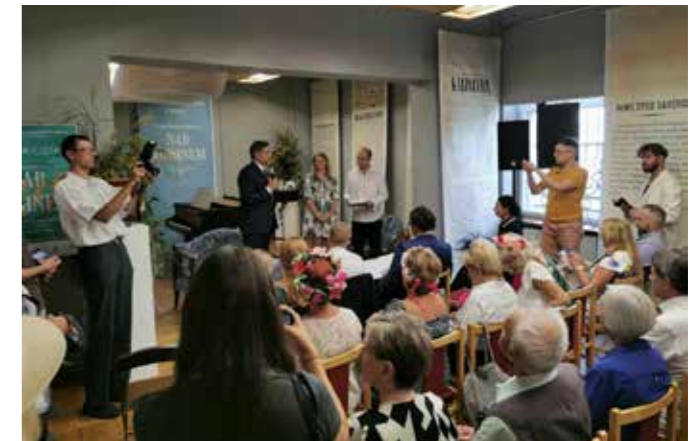
fol. MBP Kalisz