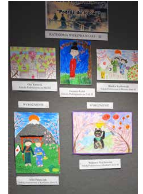
fol. Krotoszyńska BP

W grupie wiekowej klas IV-VI dwa równorzędne wyróżnienia otrzymały: Magdalena Nowak ze Szkoły Podstawowej nr 1 w Krotoszynie,