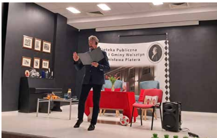
fol. BPMiG Wolsztyn

Biblioteka Publiczna Miasta i Gminy Wolsztyn im. Stanisława Platęra