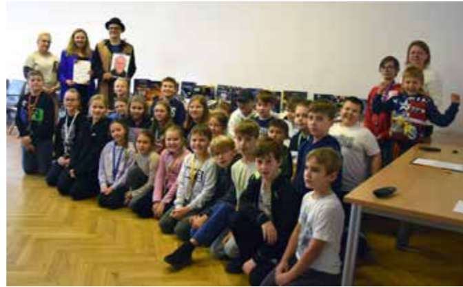
fol. Krotoszyńska BP