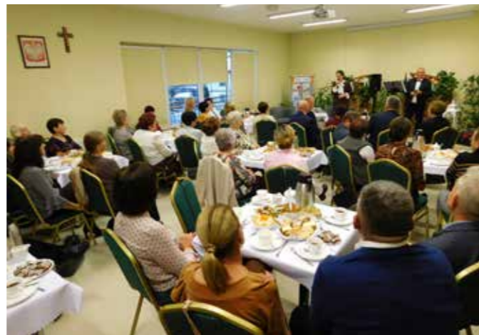
fol. GBP Trzcinica