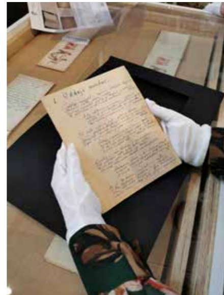
fol. MBP Kalisz

W lipcu 1917, po kryzysie przysięgowym, został internowany w Szczypiornie. Do obozu udał się na ochotnika, w mundurze sierżanta, razem z szeregowymi żołnierzami Legionów. W Szczypiornie pełnił funkcję konspiracyjnego komendanta obozu. Zadenuncjowany został wywieziony do Niemiec.