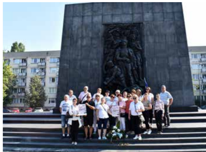
fol. GBP Trzcinica