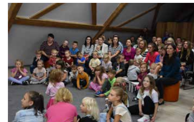
fol. BPMiG Zduny