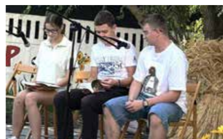
WP, Krotoszyńska Biblioteka Publiczna im. Arkadego Fiedlera w Krotoszynie

Organizatorzy dziękują wszystkim czytającym za włączenie się do akcji i pomoc przy jej organizacji. Już dzisiaj zapraszamy na 13. edycję, podczas której czytać będziemy „Kordiana” Juliusza Słowackiego.