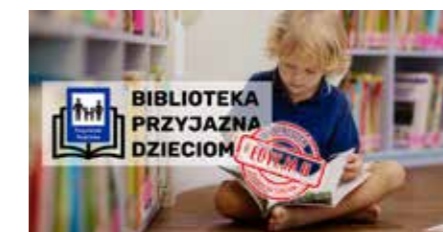
fol. Krotoszyńska BP

czytanie w Przystanku Rodzinka stanowi podstawę tej inicjatywy. Wspólny czas poświęcony lekturze książek i rozmowie inspirowanej tematami czy narracją opowieści jest niezwykle