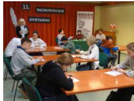
fol. MBP Wągrowiec

Elżbieta Chojnacka, Miejska Biblioteka Publiczna w Wągrowcu