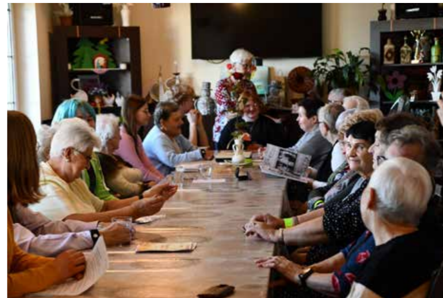
fol. MiPBP Nowy Tomysłu

Miejska i Powiatowa Biblioteka Publiczna w Nowym Tomysłu