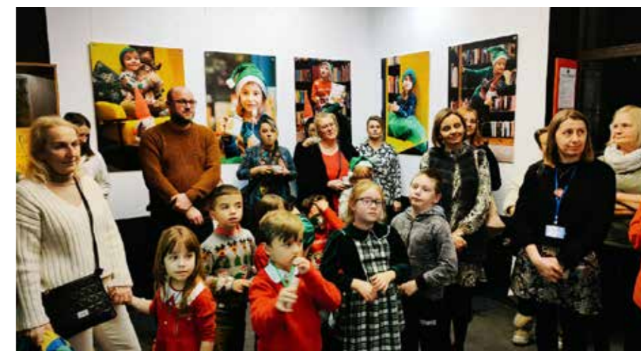
fol. MBP Kalisz

Miejska Biblioteka Publiczna im. Adama Asnyka w Kaliszu