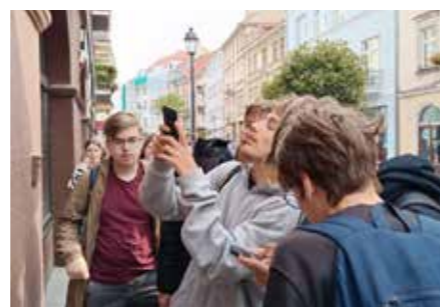
fol. MBP Kalisz

Inspirując się pracą uczniów, kolejne wersje gry opracowały instruktorki z firmy Good