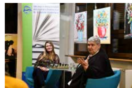
fol. MiPPB Nowy Tomysł

Miejska i Powiatowa Biblioteka Publiczna w Nowym Tomysłu