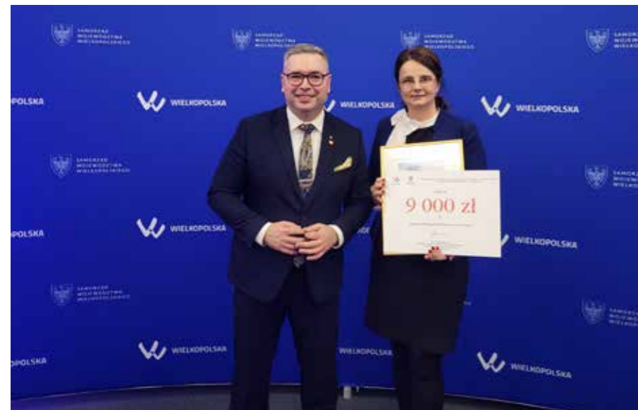
fol. GBP Trzcinyca