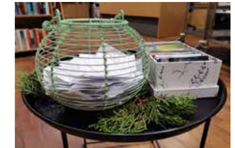
fol. BPMiG Wolsztyn

Biblioteka Publiczna Miasta i Gminy Wolsztyn im. Stanisława Platęra