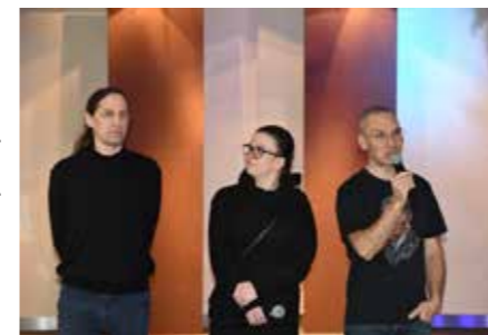
fol. MiPPB Nowy Tomyśl

W Galerii na Piętrze Miejskiej i Powiatowej Biblioteki Publicznej w Nowym Tomyszu zaprezentowana została dość intrygująca wystawa artystyczna, łącząca malarstwo Marcina Muszalskiego i fotografie Piotra i Agnieszki Bożików. Wystawa nosi tytuł „Dialog z Beksińskim, inspiracje twórczością Mistrza i nie tylko”. Interpretacja i zrozumienie dzieł artysty, takiego jak Beksiński, nie jest łatwe ze względu na ich głęboką i często enigmatyczną naturę. Dlatego też artyści podchodzą do jego sztuki jako do źródła inspiracji. Pokazane prace są próbą interpretacji dzieł Zdzisława Beksińskiego oraz sztuki o podobnej wrażliwości, np. dzieł Grzegorza Gwiazdy. Zarówno obrazy, jak też fotografie cechuje pewna mroczność, surrealistyczna wizja oraz emocjonalna głębia. Dostrzec w nich można uczucia związane z niepokojem, lękiem, izolacją, czy emocjonalnym konfliktem. Ciemna kolorystyka, głębokie cienie i kontrasty dodatkowo podkreślają atmosferę tej złożonej opowieści o ludzkiej egzystencji.