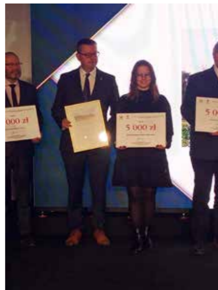
fol. BPMiG Zduny