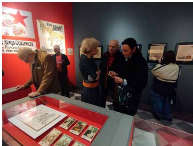
fol. MBP Kalisz