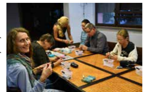
fol. MiBPB Nowy Tomyśl