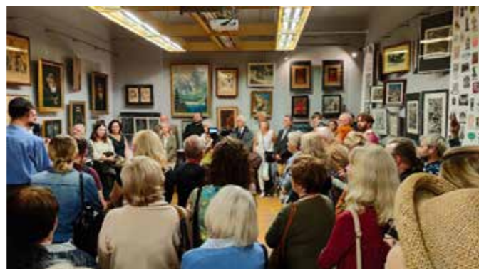
fol. MBP Kalisz