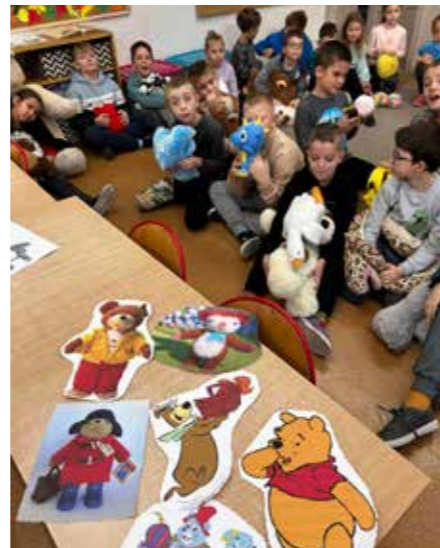
fol. BPMiG Wolsztyn