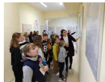
fol. GBP Trzcinica