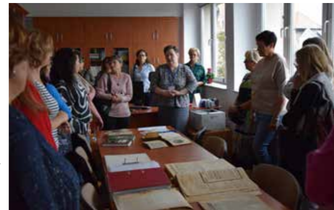
fol. Krotoszyńska BP