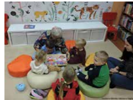
fol. PBP Wągrowiec