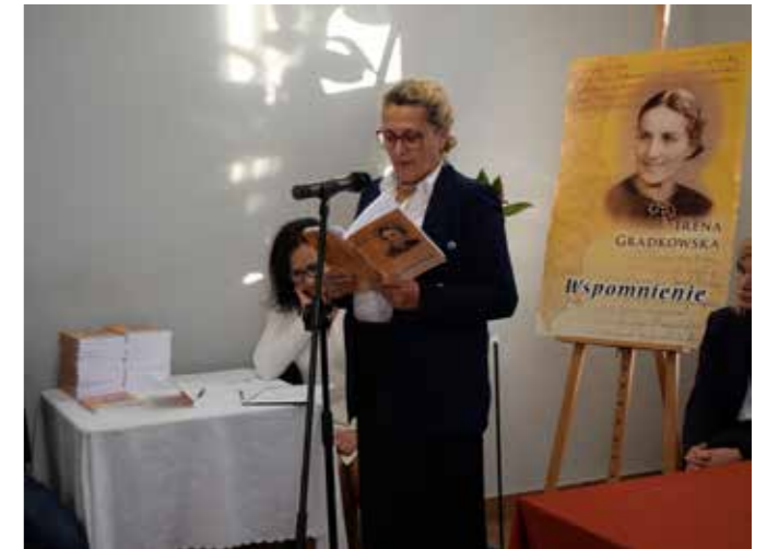
fol. GBP Ceków-Kolonia