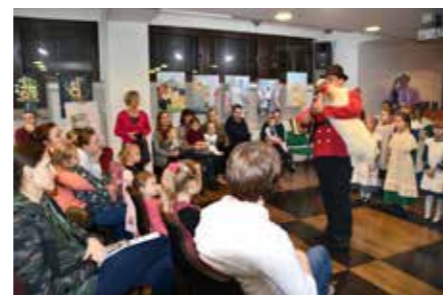
fol. MiPPB Nowy Tomyśl

Miejska i Powiatowa Biblioteka Publiczna w Nowym Tomyszu