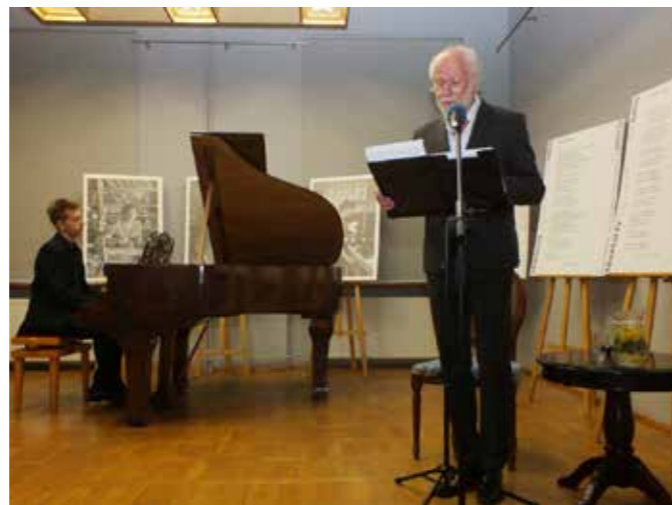
fol. MBP Kalisz