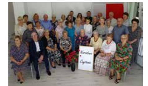
fol. BPG Grodziec

Wydarzenie poprzedziło uroczyste otwarcie lokalu przy ulicy Targowej 2a w Grodźcu,