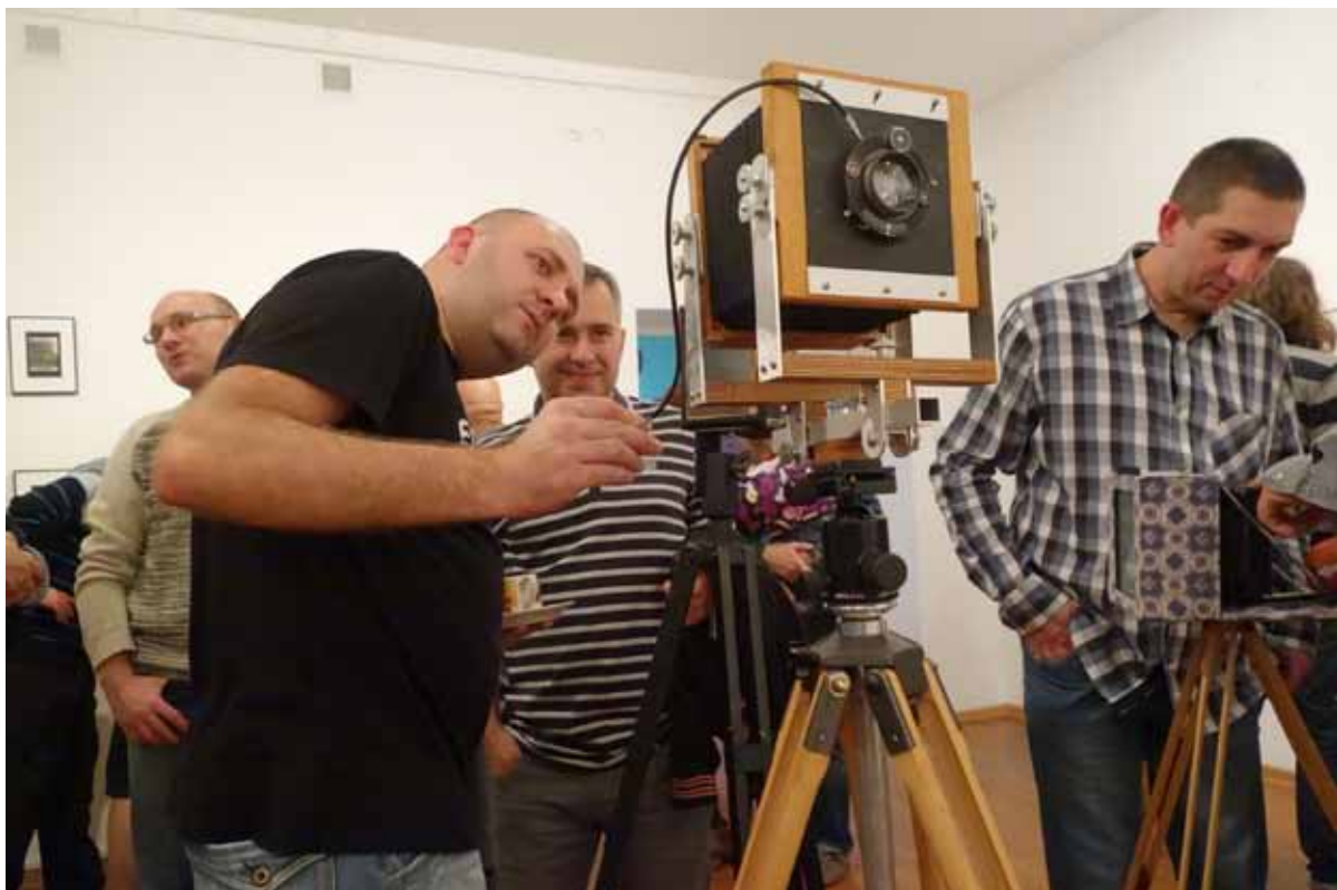
i sprzęt, którym zostały wykonane.