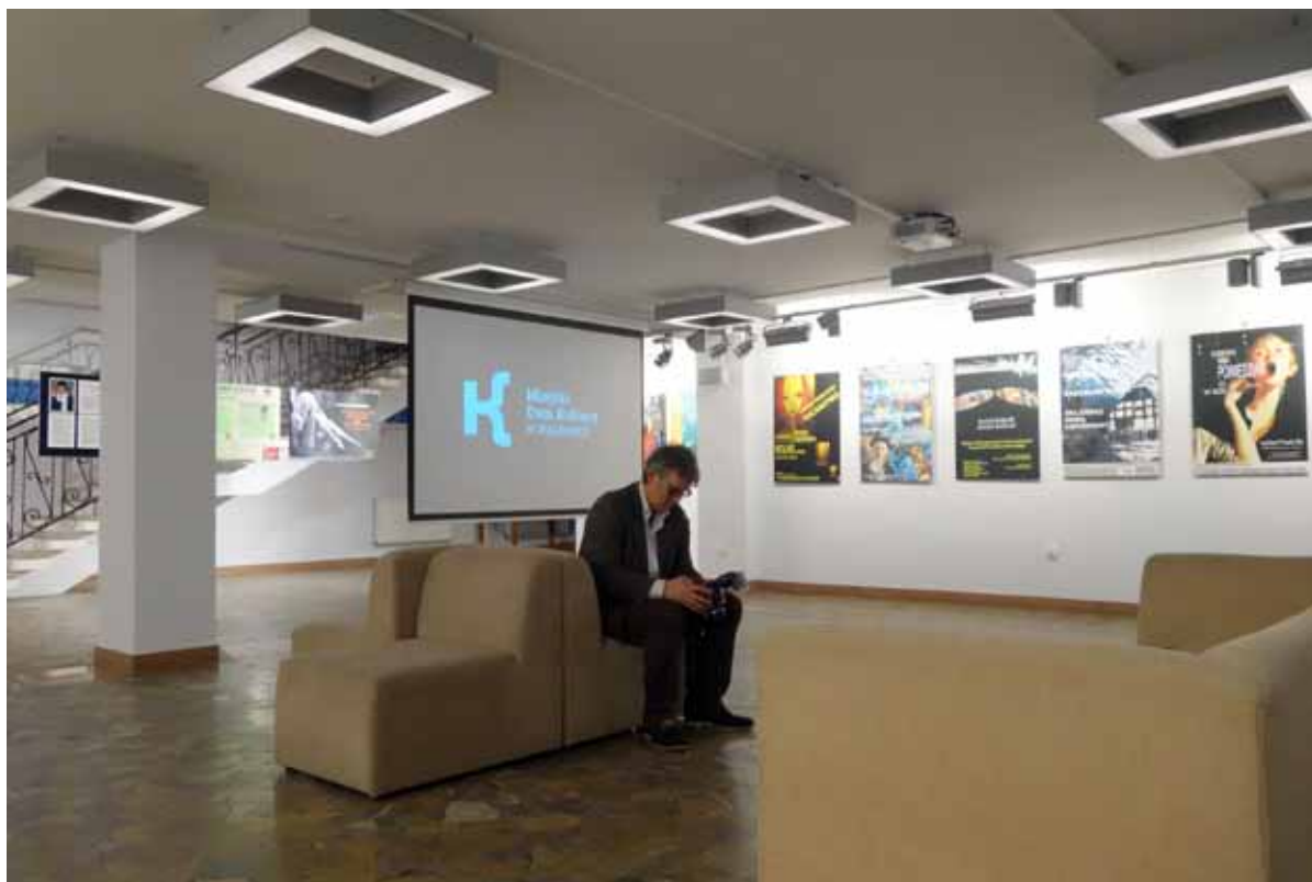
W pięknie odnowionej galerii MDK