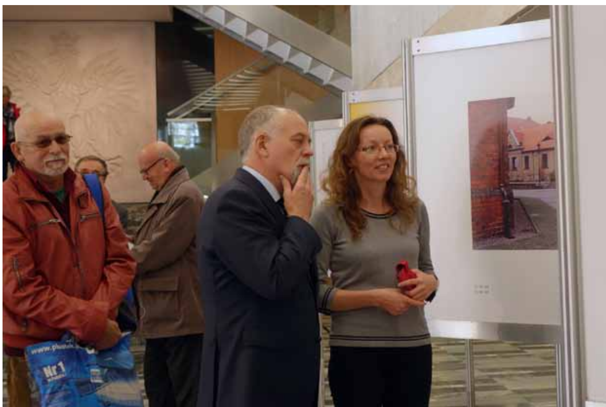
Wojewoda Piotr Florek z zainteresowaniem obejrzał prezentowane fotografie.