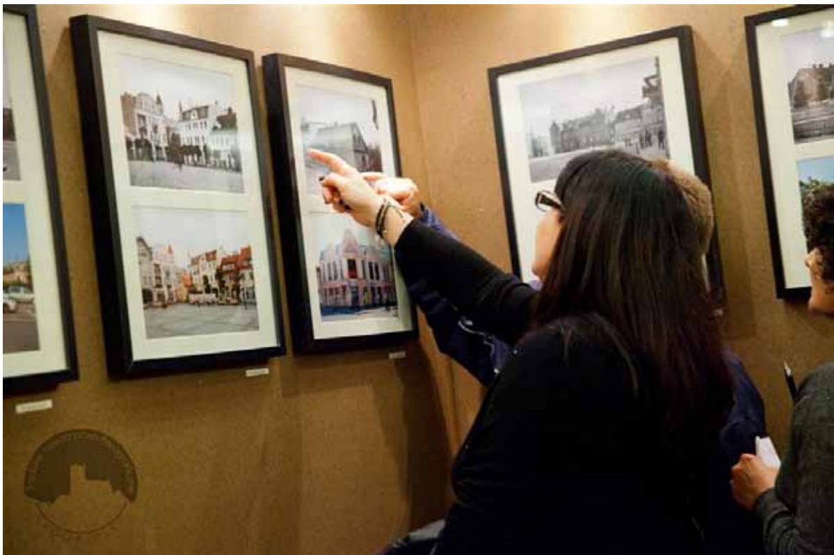
Średzkie Towarzystwo Fotograficzne; wykorzystując zbiory swojego archiwum; postanowiło nadać starym fotografiom PAF-u jeszcze mocniejszego wydźwięku i zestawić je z fotografiami własnego autorstwa,