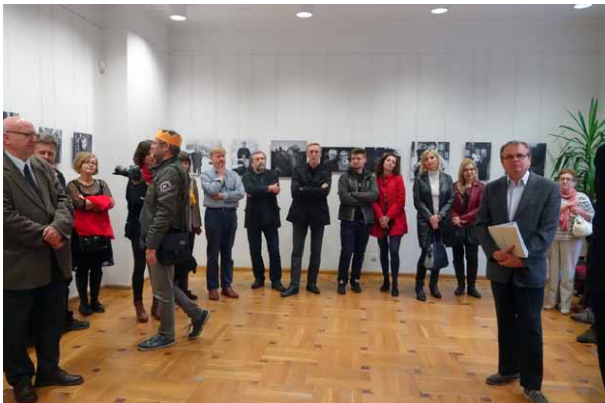
zaprezentowali fragmenty projektu „Mieszkańcy”.