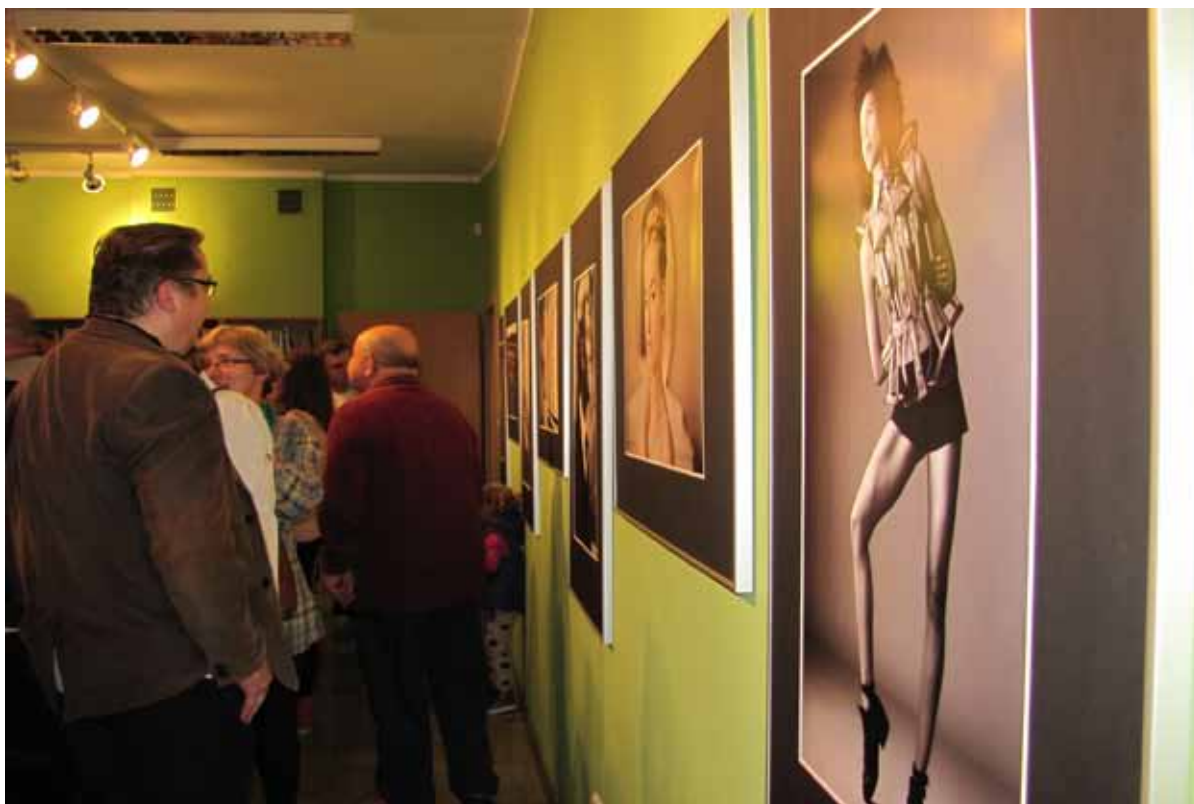
specjalnością autorki jest fotografia portretowa oraz moda.