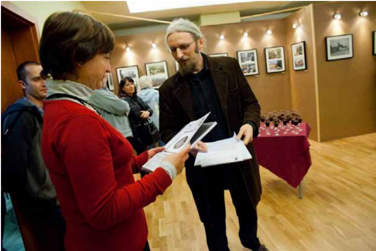
Organizatorem wystawy „Obrazy czasu” jest Średzkie Towarzystwo Fotograficzne - prezes Bartłomiej Król