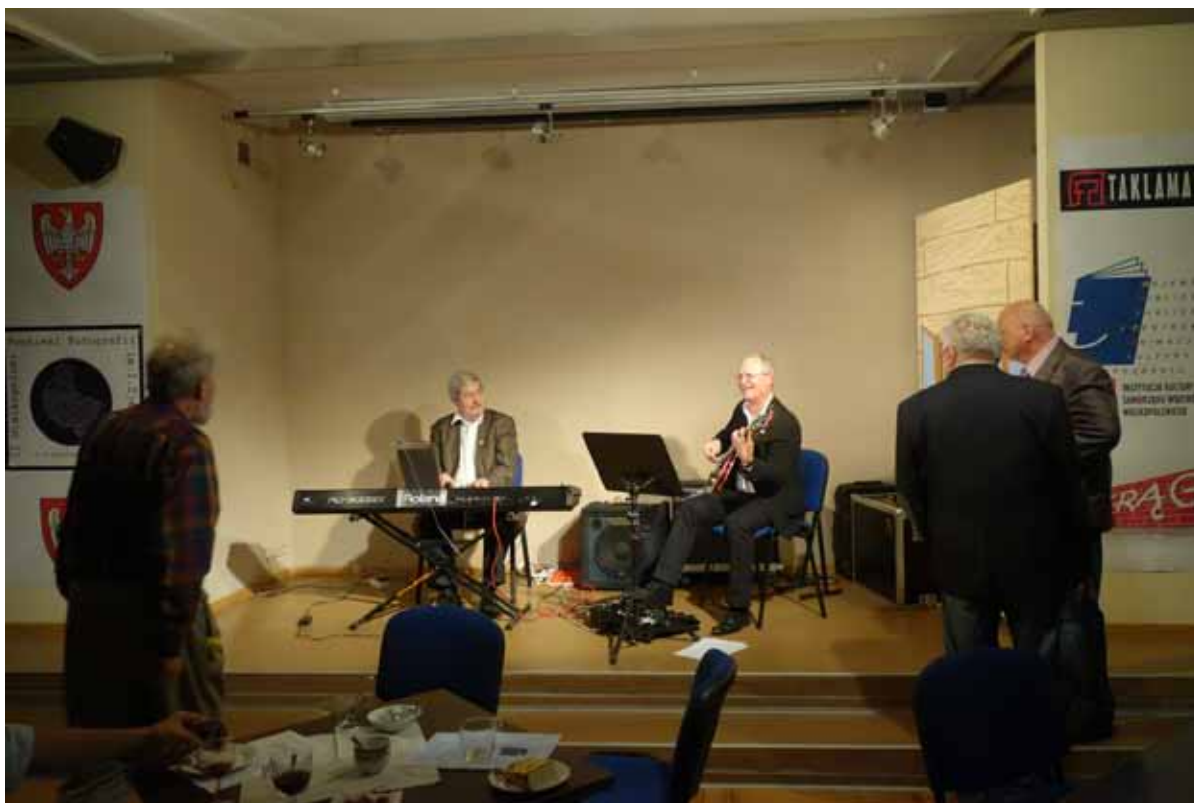
Wieczór zakończył krótki koncert zespołu TAKLAMAKAN z Opalenicy