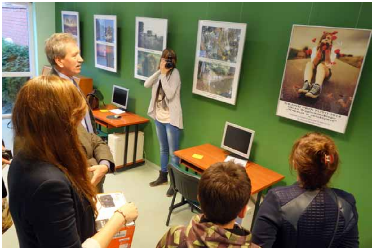
i jeszcze jedno spojrzenie na zwycięskie zdjęcie.