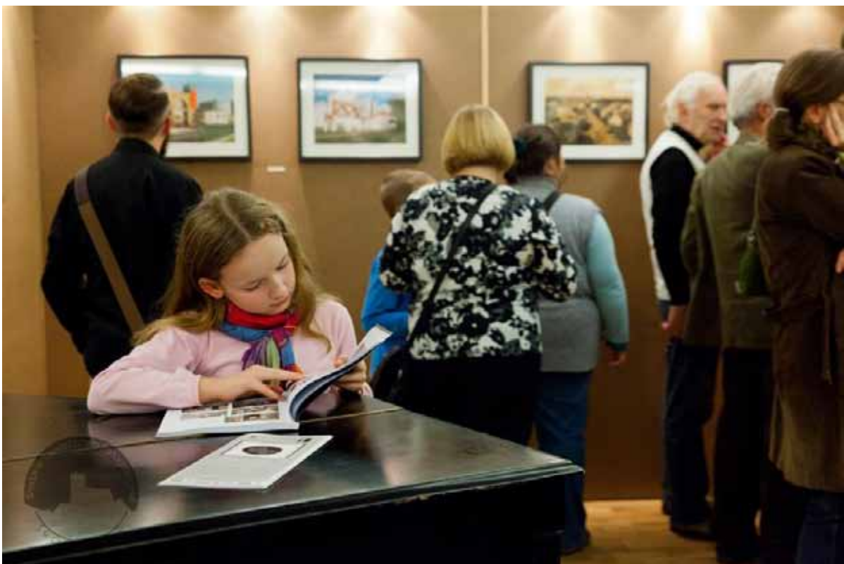
...mogli zapoznać się z katalogiem wszystkich festiwalowych imprez.