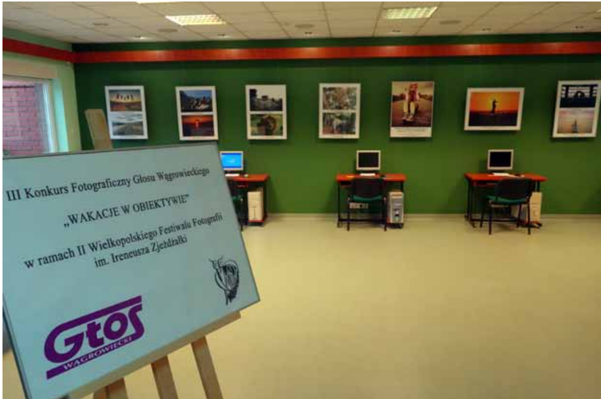
WAKACJE W OBIEKTYWIE - wystawa pokonkursowa