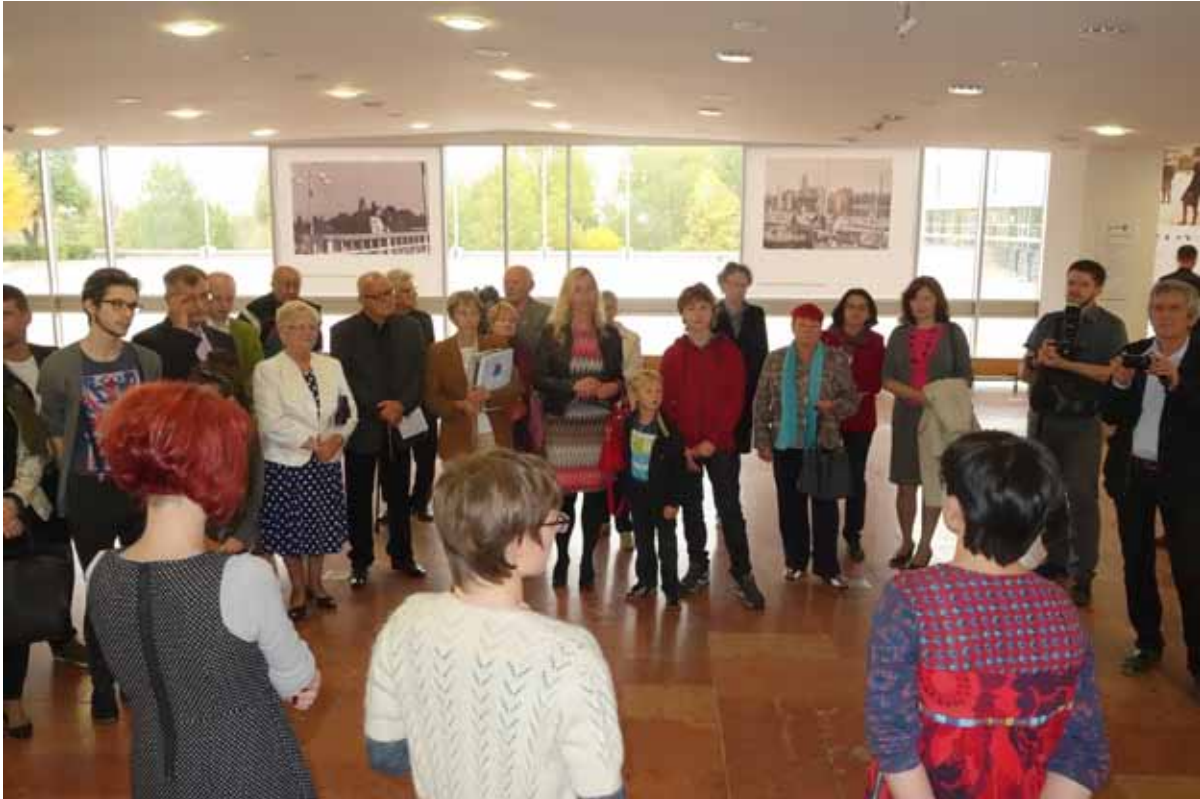
Na wernisżu pojawiło się sporo miłośników Gniezna i fotografii