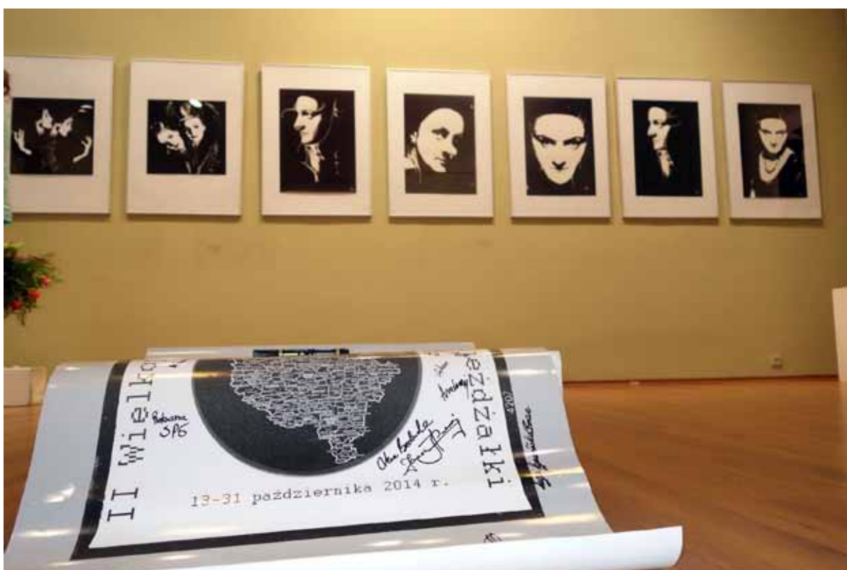
... na pamiątkę zostanie plakat.