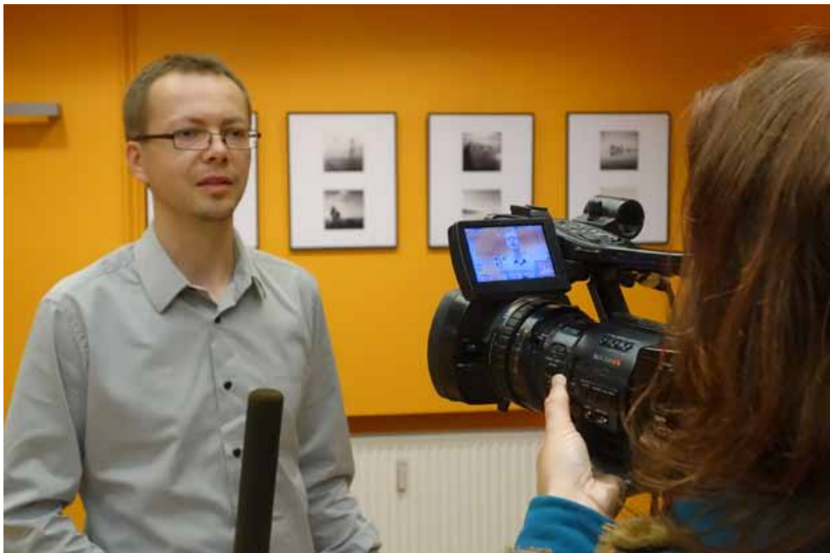
kurator: Michał Koralewski