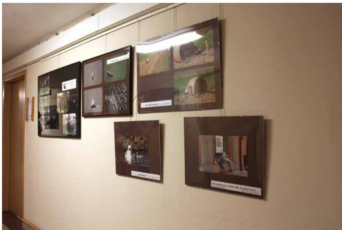
Fragment wystawy członków Grupy pt.: „FotoStawka Obok”