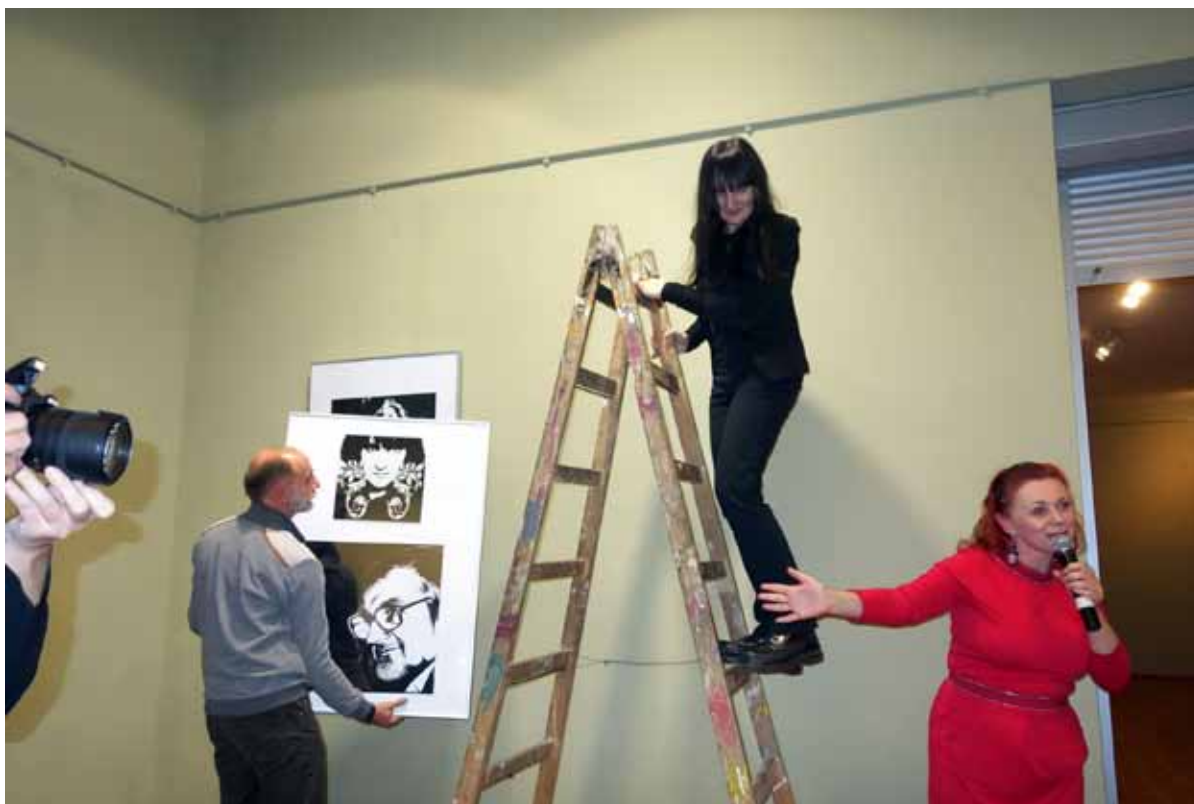
symboliczny demontaż wystawy

Gniezno, Miejski Ośrodek Kultury im. Klemensa Waberskiego 30.10.2014