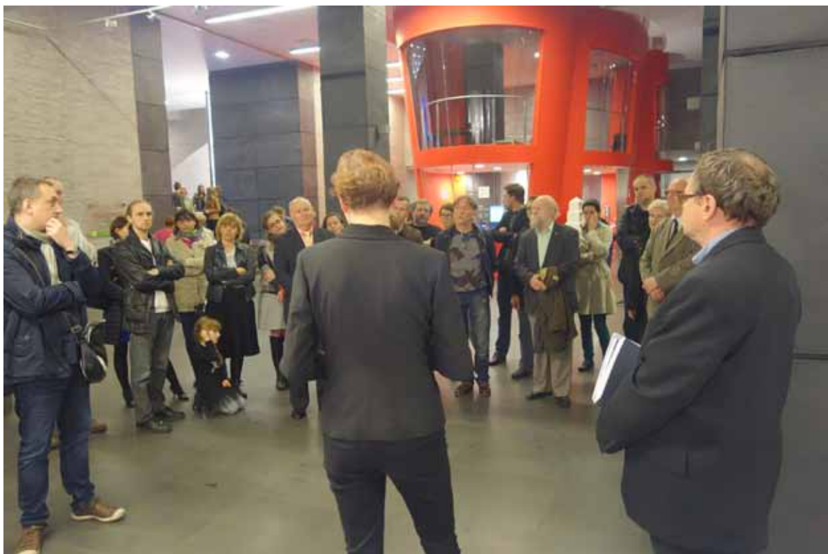
a wernisaż zgromadził spore grono przyjaciół artysty