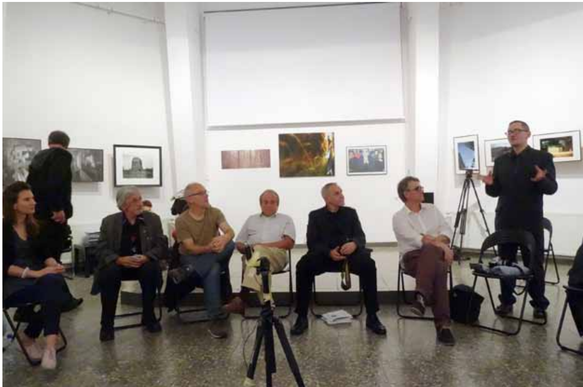
i panelem dyskusyjnym na temat regionalizmu w fotografii.