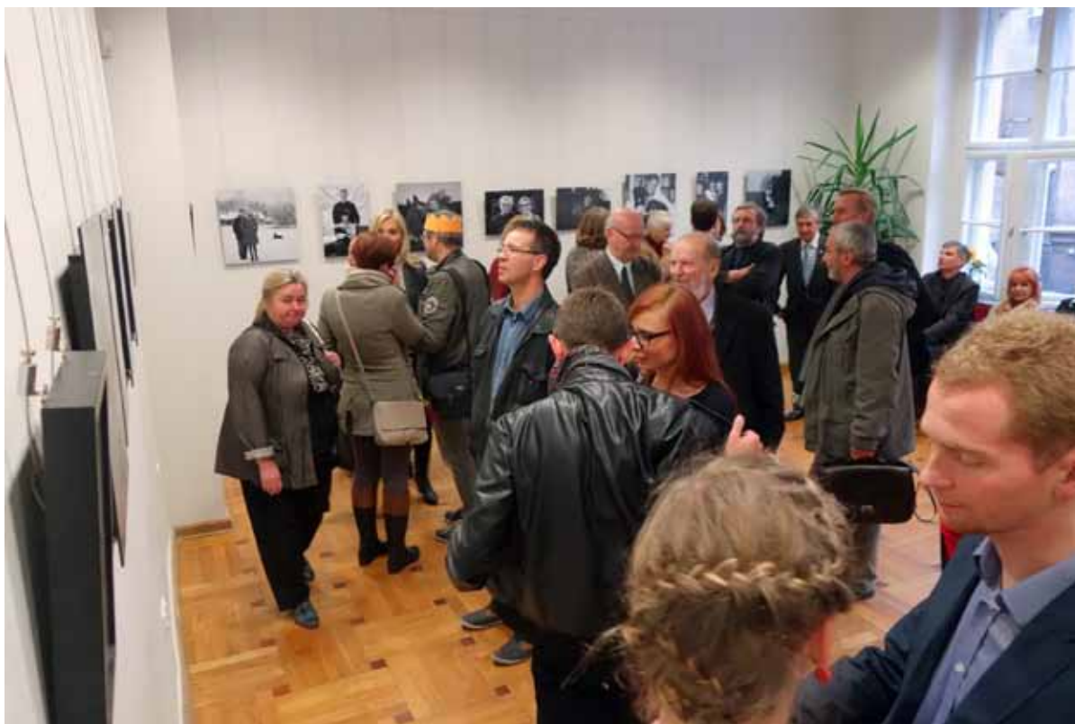
Na wernisaż zostali zaproszeni sportretowani mieszkańcy Sołacza i Nekielki