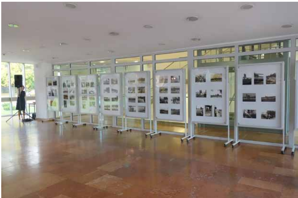
na wystawę pozyskano archiwalne zdjęcia z prywatnych kolekcji mieszkańców miasta