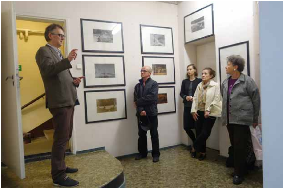
Autor zdjęć - Lech Szymanowski opowiada o „kamiennych kręgach”