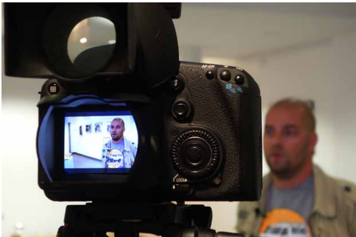
Autor wystawy „Team Chittagong” - Jerzy Wierzbicki