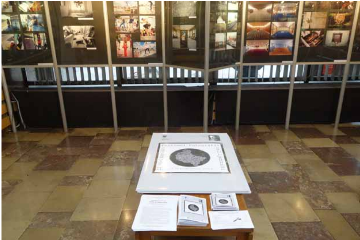
Wystawa pokonkursowa „Moja Wielkopolska 2014”