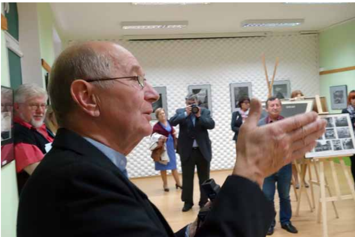
Autor ze swadą opowiadał o ponad 50-letniej twórczości.