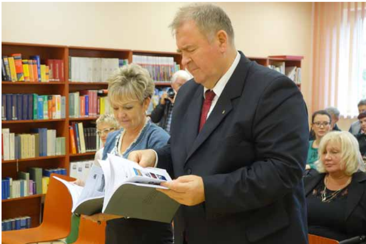
oraz władzom miasta