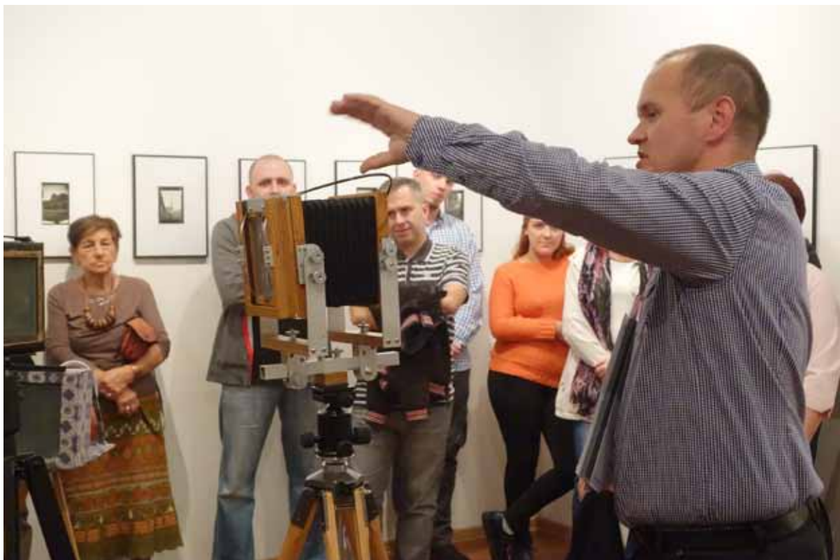
Zdjęcia zostały wykonane aparatami miechowymi – zarówno starymi kilkudziesięcioletnimi kamerami, jak i zbudowanymi własnoręcznie „wielkoformatowcami”.