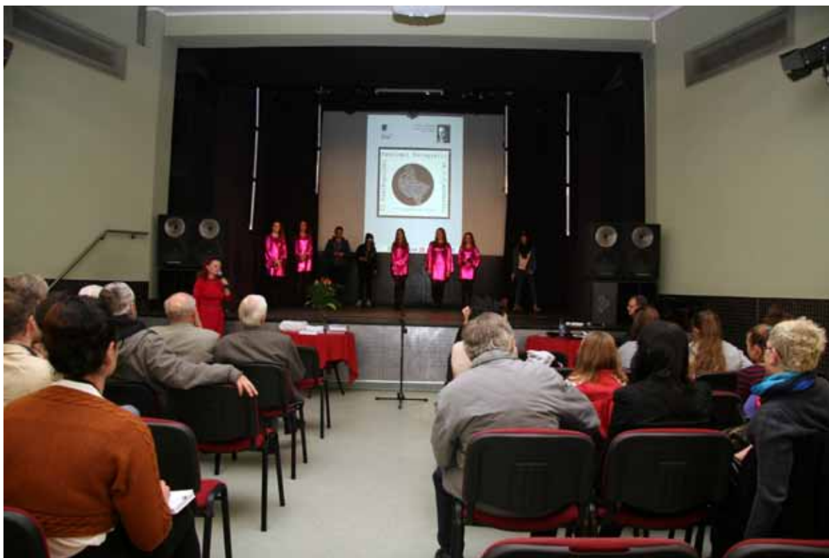
Zakończenie festiwalu rozpoczęło się w sali widowiskowej MOK- występem własnych zespołów artystycznych

Gniezno, Miejski Ośrodek Kultury im. Klemensa Waberskiego 30.10.2014