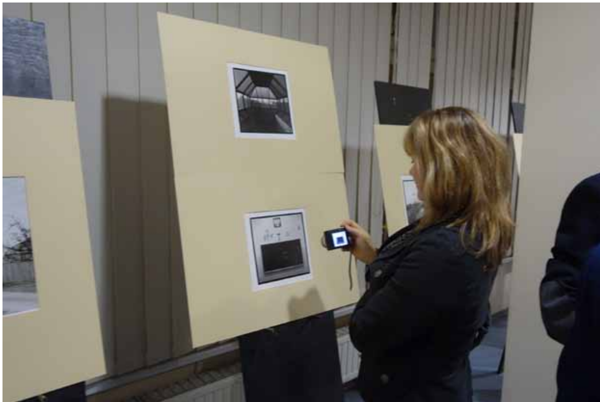
Ozdobą wystawy są zdjęcia Ireneusza Zjeżdżałki - uczestnika opalenickiego pleneru w 2003 r.