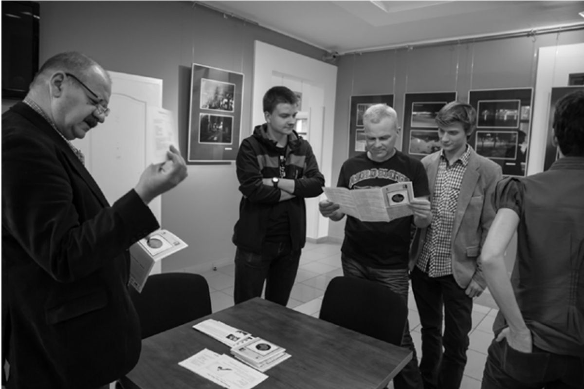
Wystawa „Konin po zmroku” w CKiS w Koninie