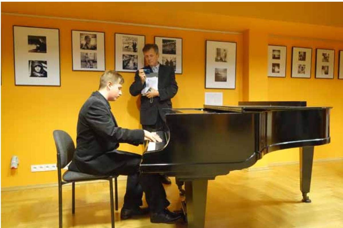
atmosferę fotograficznego święta wzmocniały tony fortepianowej muzyki