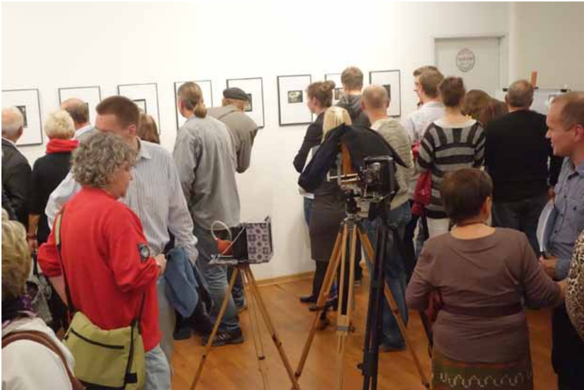
Tłum zwiedzających podziwiał zdjęcia