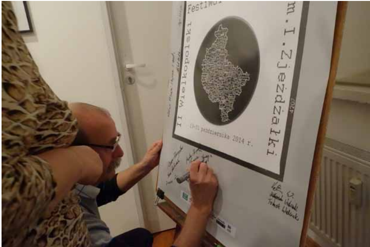
Uczestnicy wernisażu pozostawiali niezwykłą pamiatkę - podpis na plakacie festiwalu