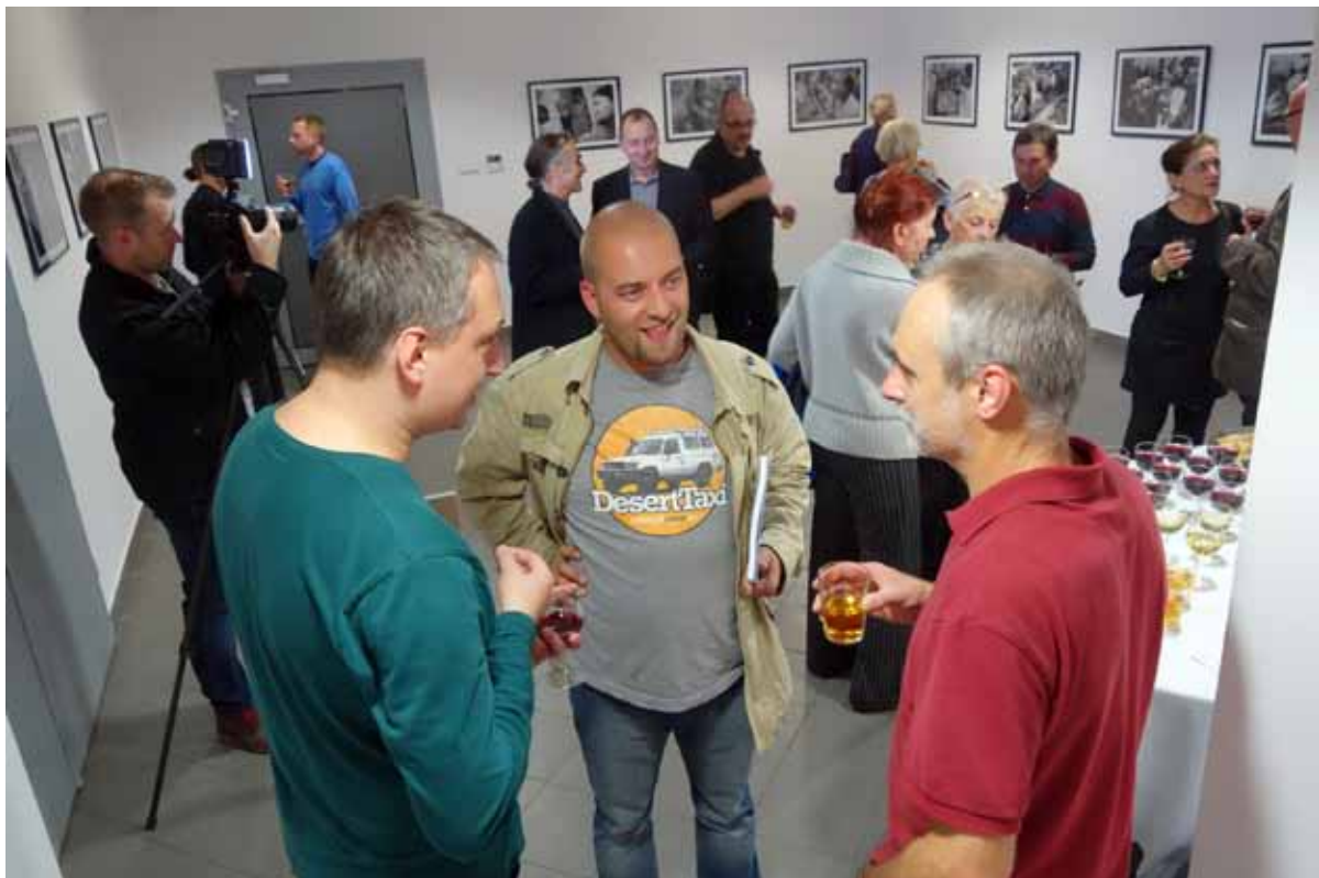
autor i wernisażowi goście