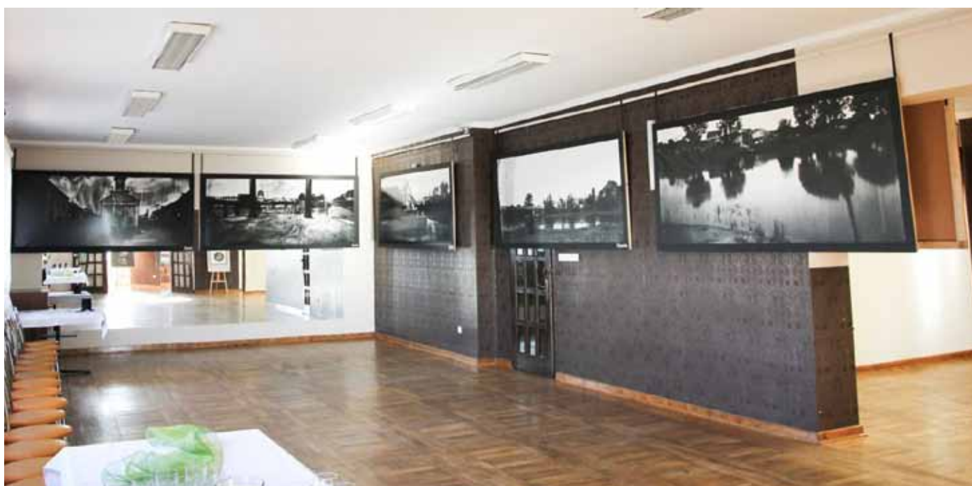
Drugą prezentowaną tu wystawą była „Warta - topografia lokalności”