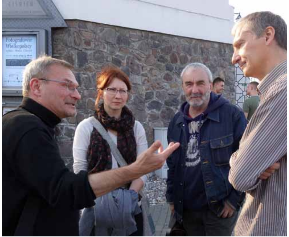
Oficjalne rozpoczęcie festiwalu zaplanowano w Galerii CKiS w Koninie wystawą „Fotografowie Wielkopolscy”