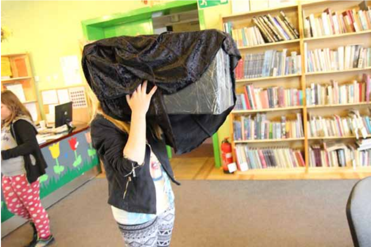
Warsztaty fotografii otworkowej