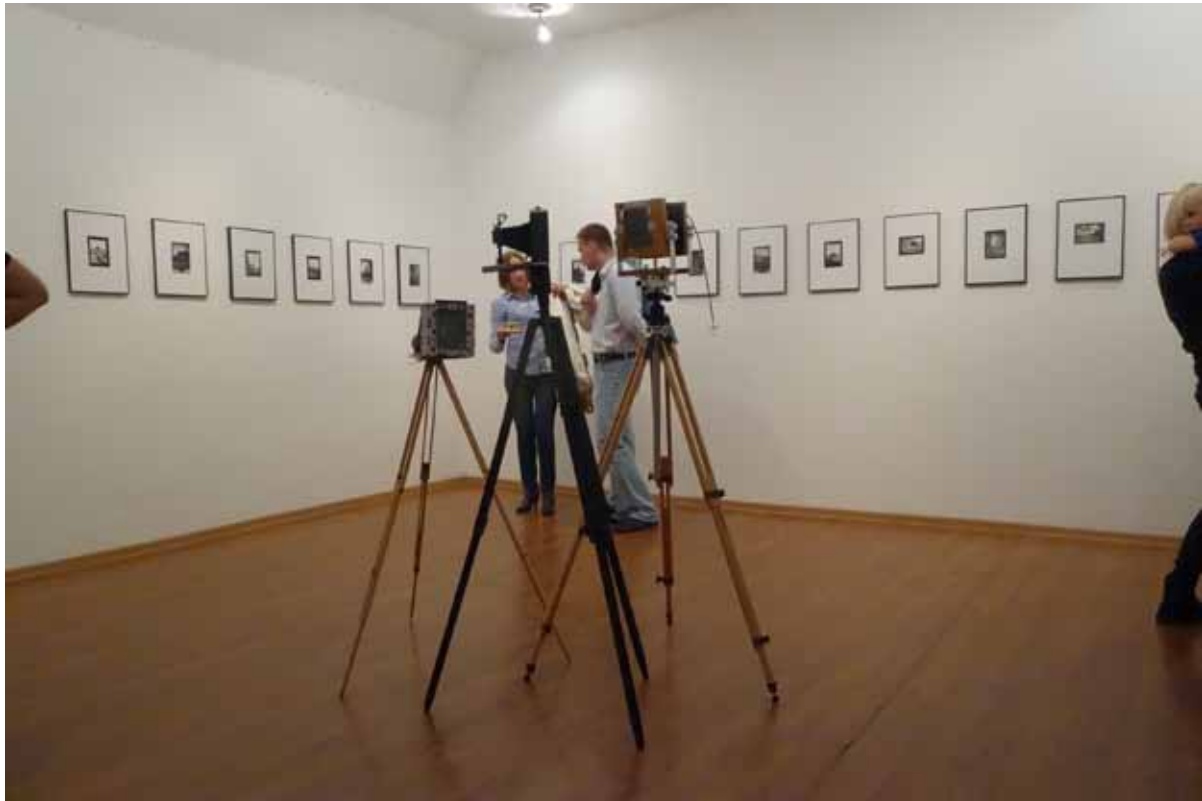
„Poza czasem” to cykl kilkudziesięciu miniatur fotograficznych.