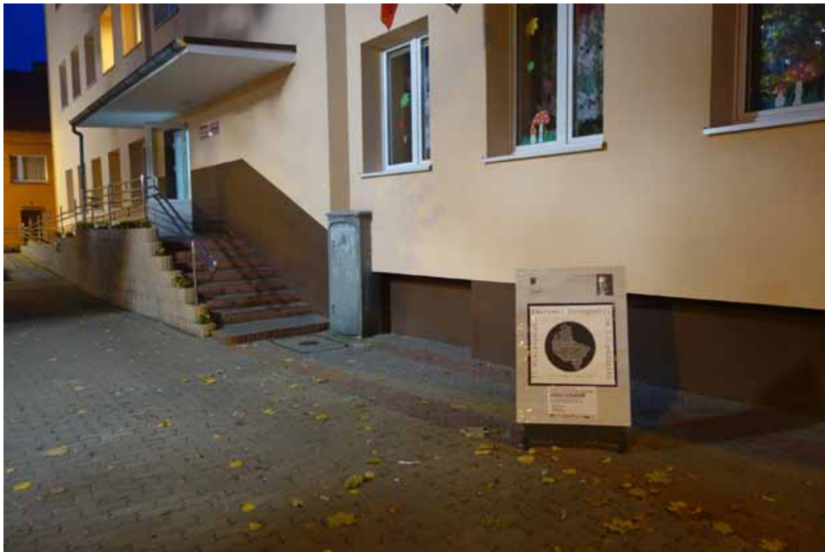
Plakat festiwalowy przed Domem Kultury w Trzemesznie zapraszający na wystawę „Poza czasem”