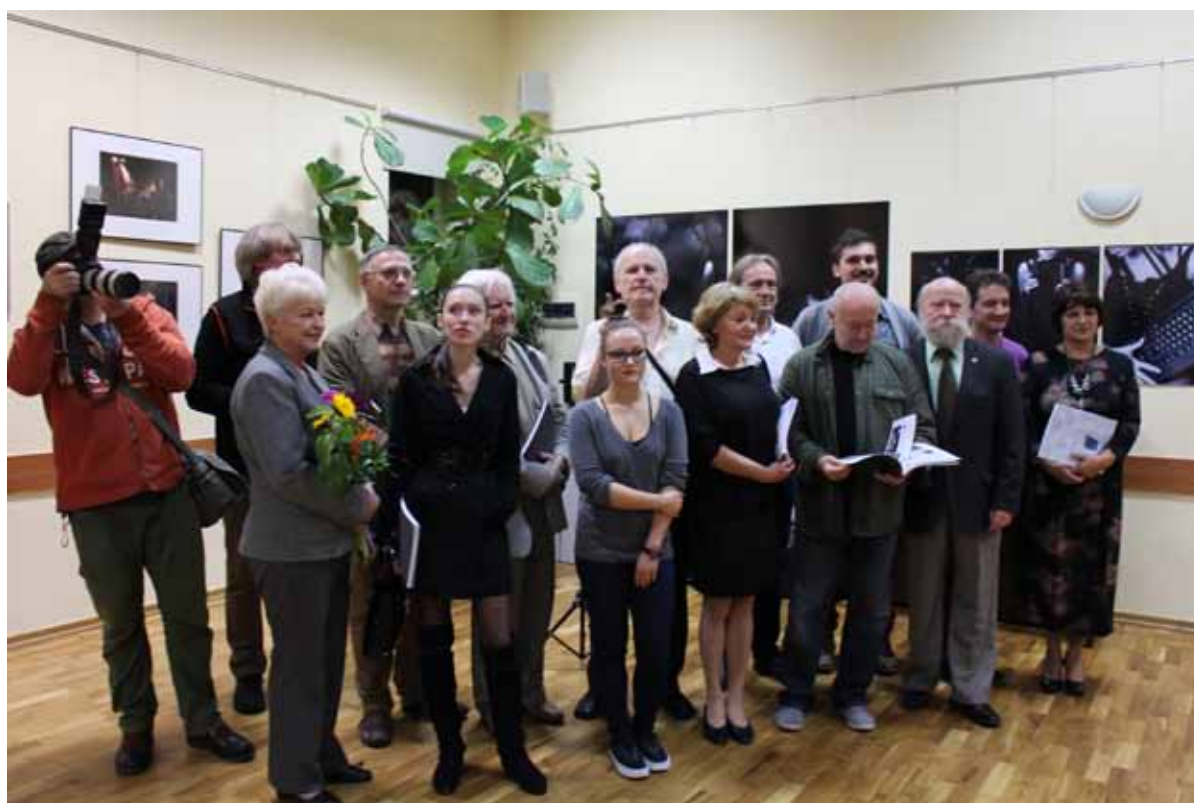
Pamiątkowe zdjęcie wszystkich uczestników