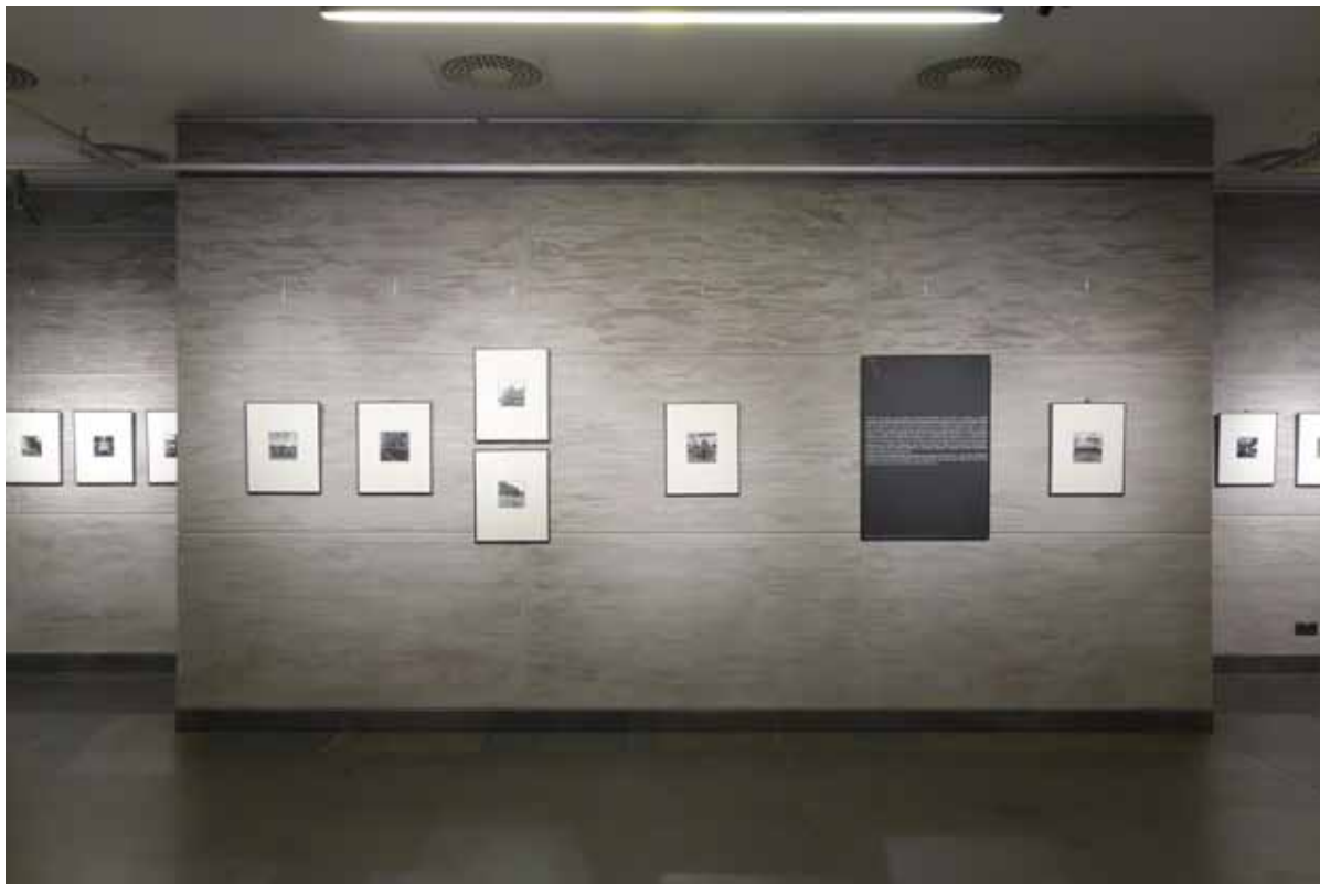
W CK ZAMEK zaprezentowano wystawę fotografii patrona festiwalu Ireneusza Zjeżdżałki.

Poznań, Centrum Kultury ZAMEK 14.10.2014