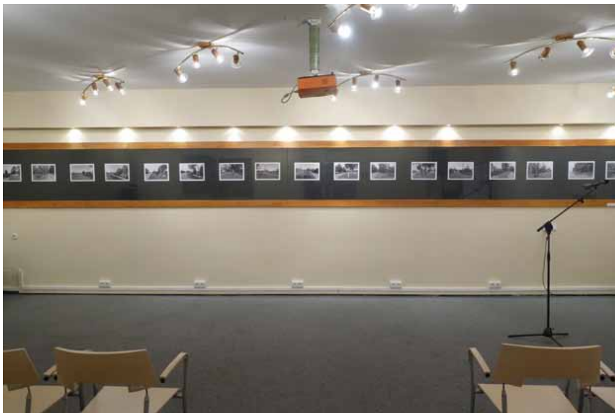
Piotr Chojnacki - „Krzyże Puszczy Zielonka”