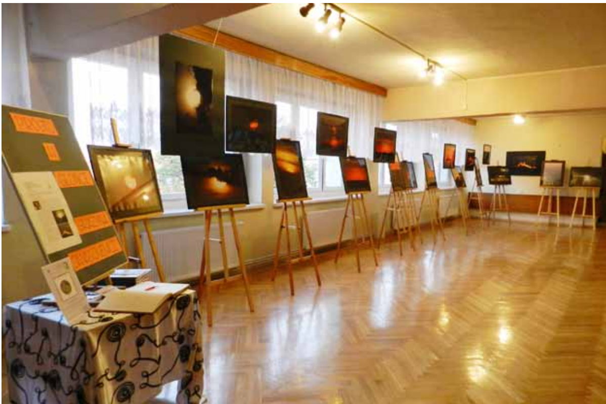
Wystawa składa się z 20 zdjęć przedstawiających zachody Słońca, sfotografowane z mieszkania położonego na 16 ptr.