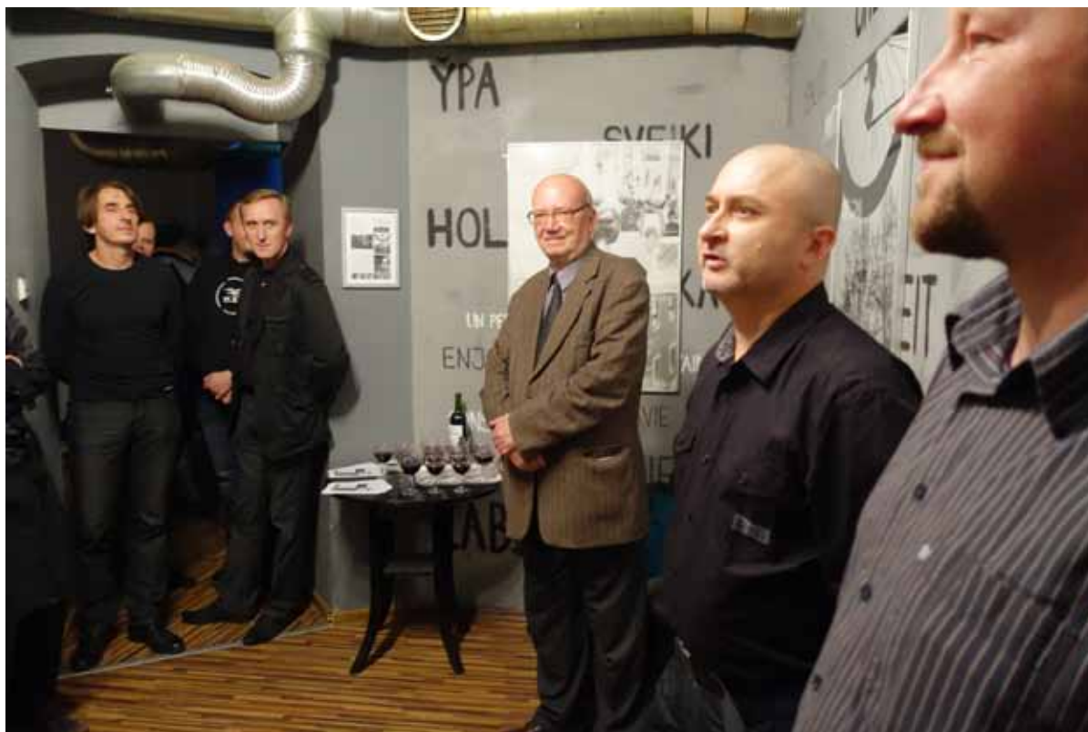
W klubie przy ul. Nowowiejskiego w Poznaniu, od paru lat spotyka się Kolektyw Fotograficzny ŚWIETLICA