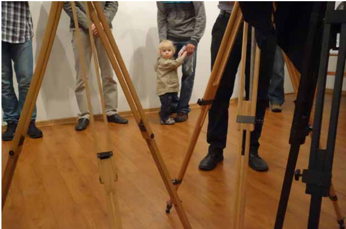
Przygotowywanie do sztuki zaczyna się od najmłodszych lat.