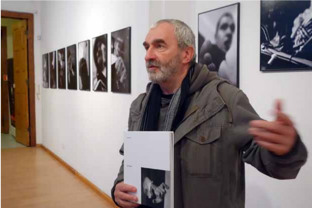
wystawie towarzyszy album wydawnictwa KROPKA, do którego wstęp napisał Krzysztof Szymoniak