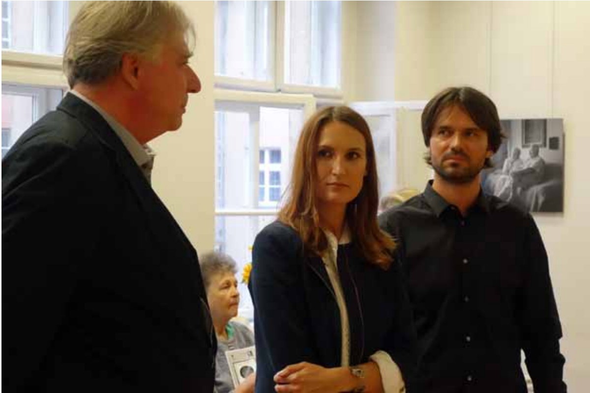
PGF INNA, czyli duet fotografów Anna B. Gregorczyk i Łukasz Szamałek