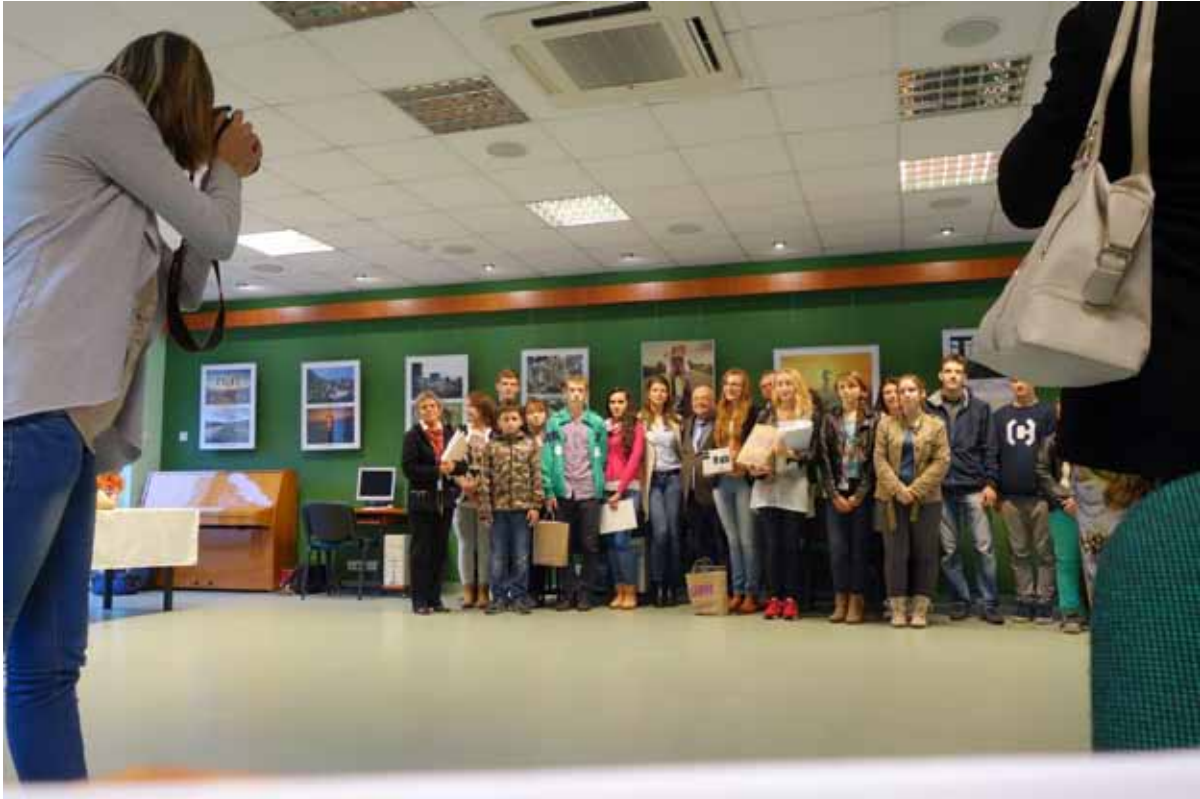
Pamiątkowe zdjęcie wszystkich uczestników