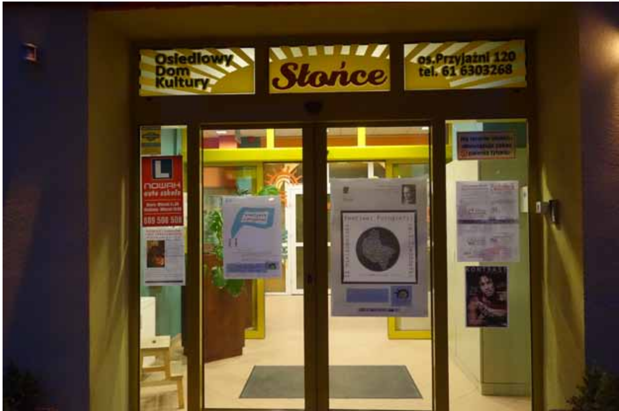
„Bez pośpiechu. Opowieści z ulic i podwórek” - Wystawa zorganizowana przez Grupę Entuzjastów Fotografii Mobilnej „Mobilni”