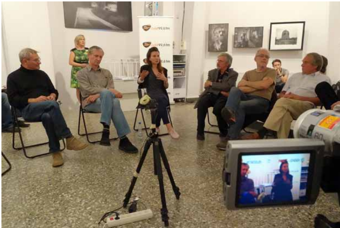
Wzięli w nim udział bohaterowie serii wydawniczej „Fotografowie Wielkopolski”