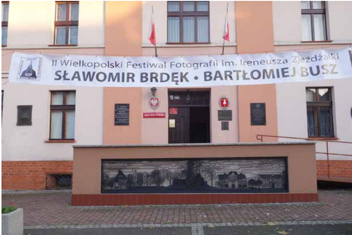
Dwie kolejne wystawy zostały usytuowane w ostrzeszowskim muzeum

Ostrzeszów, Muzeum Regionalne 26.10.2014