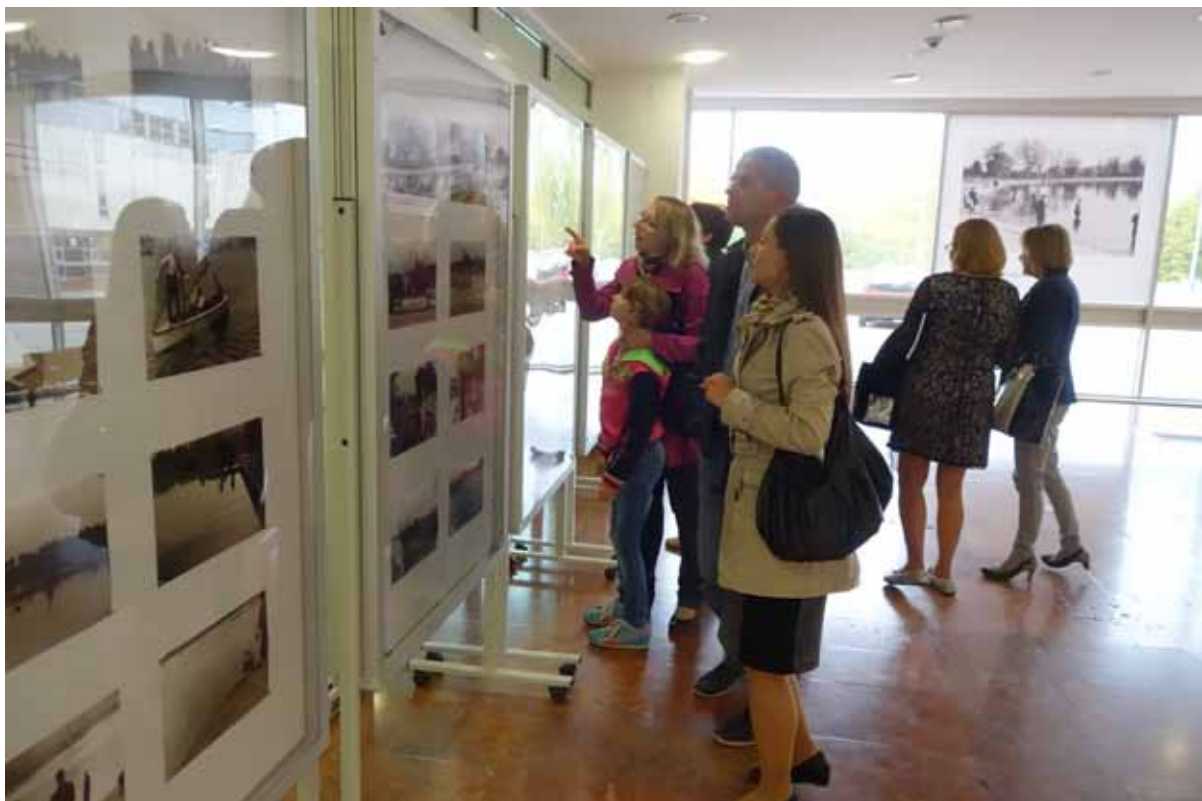
Fragment ekspozycji i zwiedzający...