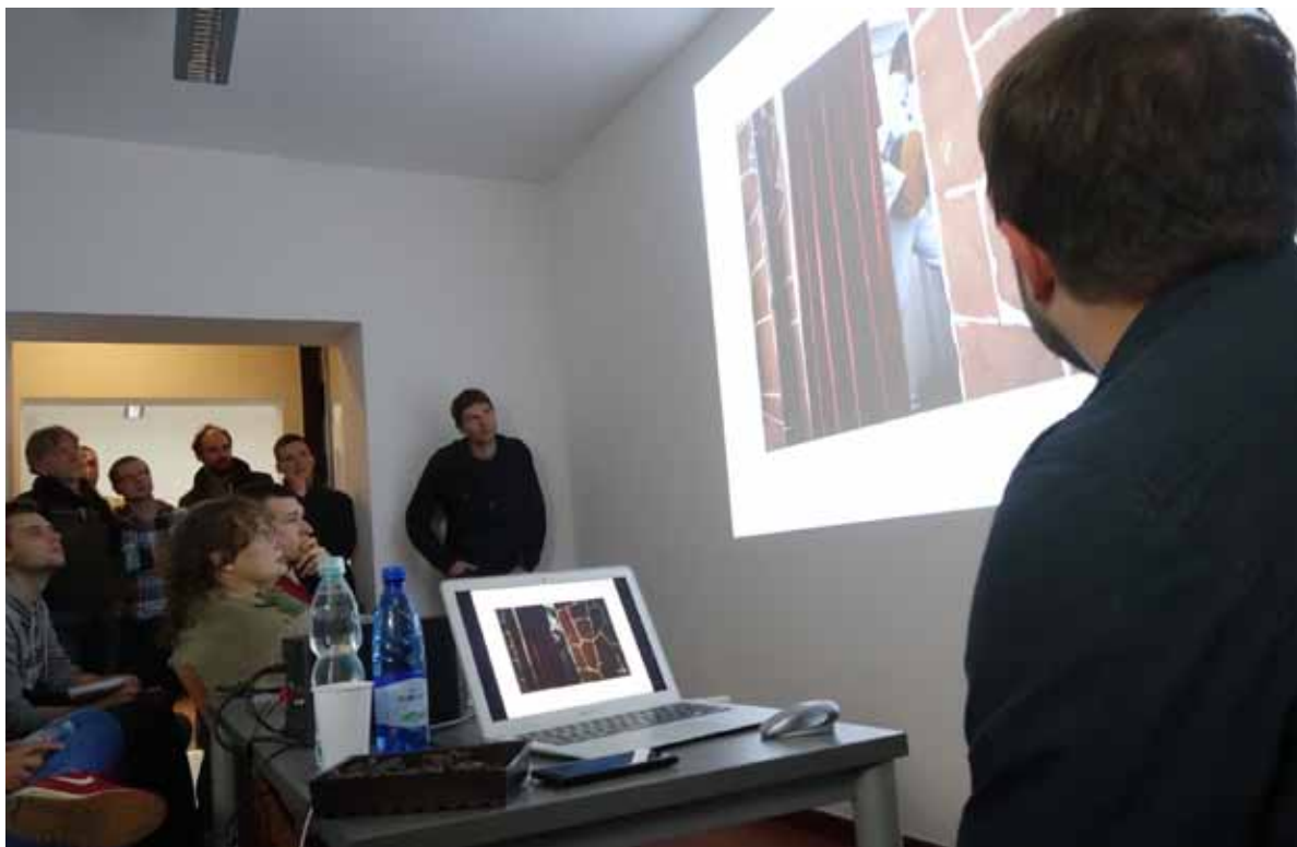
Wielkopolska/Teraz to projekt realizowany w ramach ZPAF Okręg Wielkopolski przez czwórkę fotografów: Michała Adamskiego, Andrzeja Dobosza, Mariusza Foreckiego i Adriana Wykrotę,