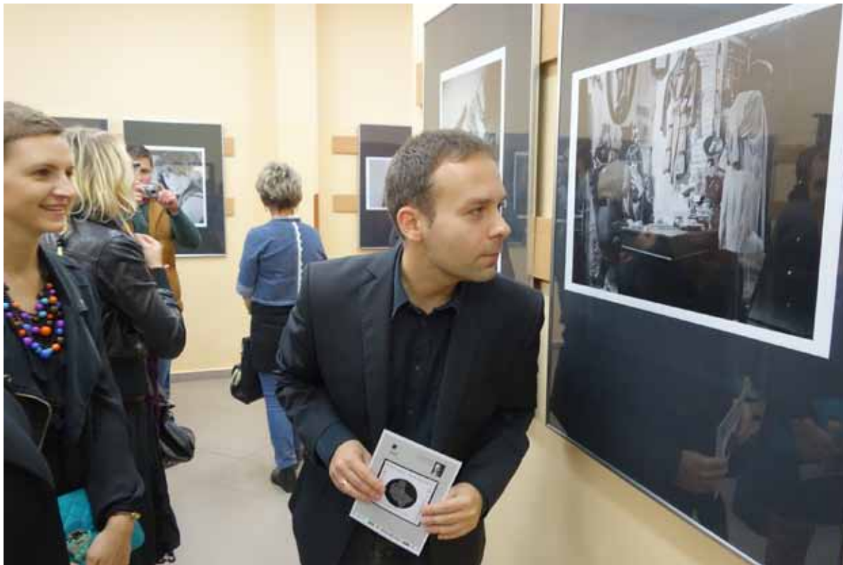
Prezentowane zdjęcia wzbudziły spore zainteresowanie zwiedzających