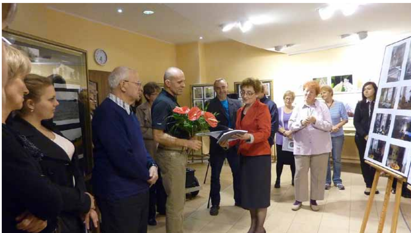
Wernisaż, podziękowanie wręcza autorowi dyrektorka biblioteki.