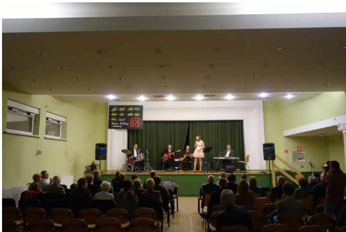
Wernisaż rozpoczął się krótkim koncertem miejscowego zespołu muzycznego