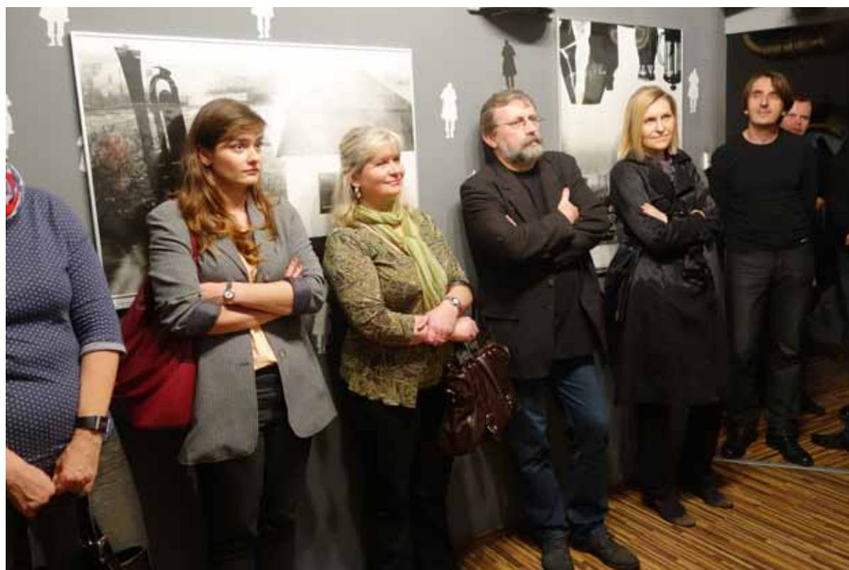
uczestnicy wernisażu wystawy INSIDE-OUTSIDE