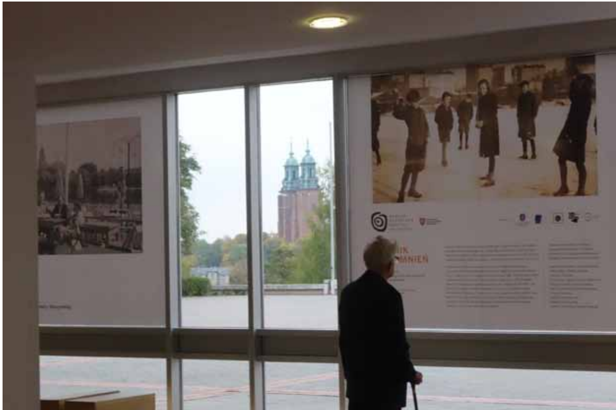
„Pomnik wspomnień” - projekt wystawienniczo - edukacyjny zrealizowany przez Muzeum Początków Państwa Polskiego w Gnieźnie