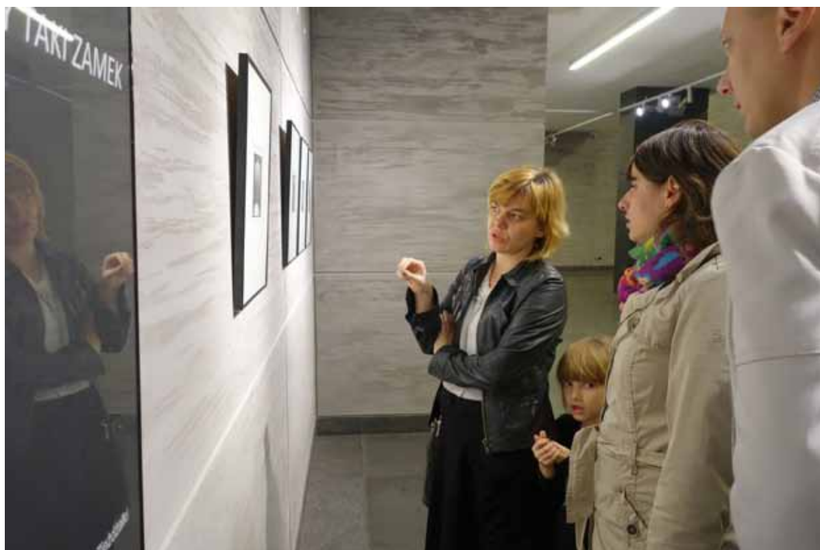
Gośćmi specjalnymi wernisażu były żona i córka fotografa.