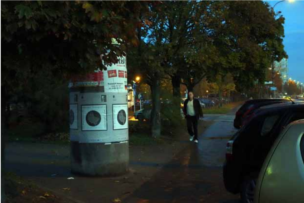
Zmierzając do DK „Pod lipami” mijamy słup ogłoszeniowy oklejony festiwalowymi plakatami