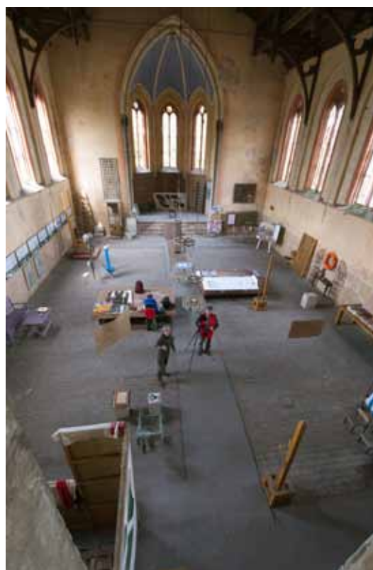
galeria zewnątrz i wewnątrz