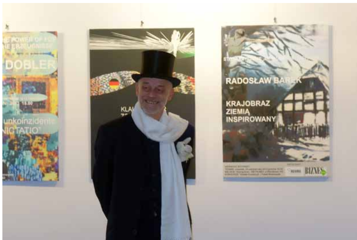
zawisły fotograficzne plakaty Pawła Baranowskiego