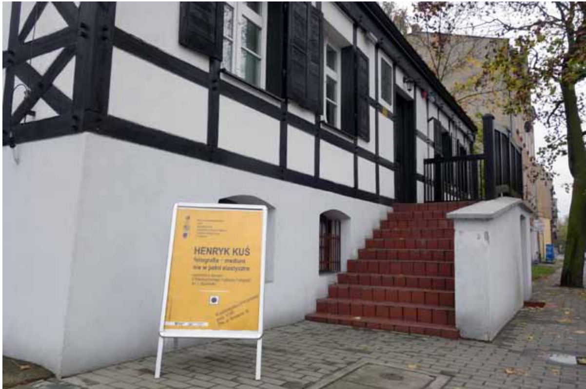
Muzeum Stanisława Staszica